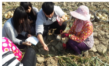
圖 2 採訪過程