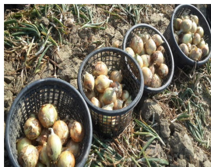
圖 1 採收後的洋蔥

洋蔥原產於中亞或西亞，現有很多不同的品種，已經用於世界各地的食物。在西元前一千年的古埃及石刻中就有收穫洋蔥的圖畫，之後傳到地中海區。西漢時，張騫通西域，從西域帶回許多物種。臺灣總督府農業試驗所自 1918 年起，在臺灣各地試驗栽植洋蔥，但是成效不佳。第二次世界大戰結束後，臺灣省農業試驗所在省農林廳和農復會的贊助下，繼續引進各品種洋蔥，在臺灣各地試種。在臺灣南部雲林、嘉義、台南、屏東一帶種植成功，恆春、楓港、車城等地成為台灣最大洋蔥產地。