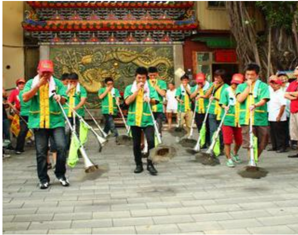
圖 6 前鎮 2011/09/25