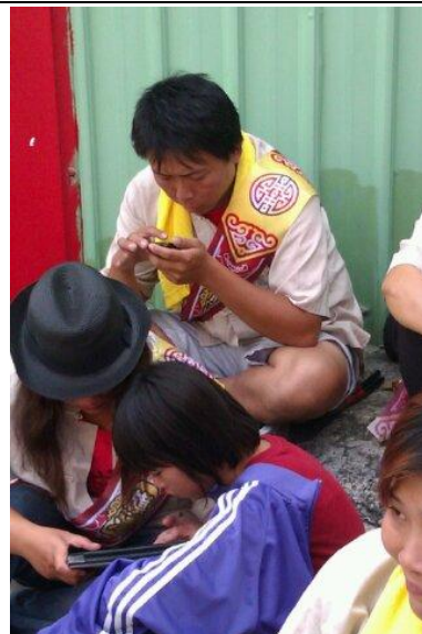
這位是副團長，忙玩手機中