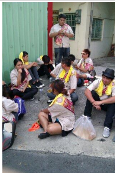
吃燒酒螺 喝飲料中