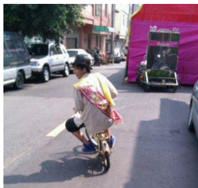
團員搶小孩的腳踏車