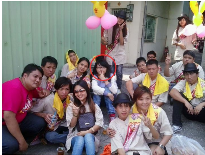
2012/10/21 旗津 濟元堂