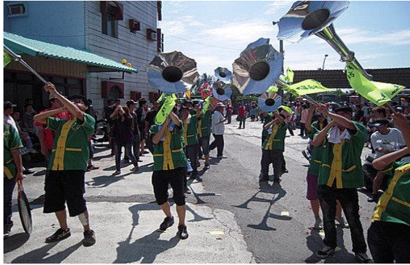
圖 5 旗津 2011/08/24