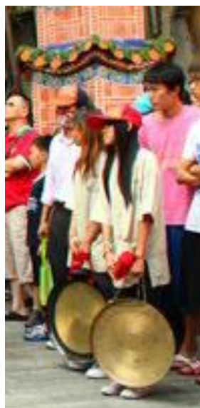
圖 2 兩面鑼

整個隊伍前方有三面旗幟、兩面鑼、其餘為 L 型的哨角（號頭）和直式的哨角所組成，哨角必須是雙數。