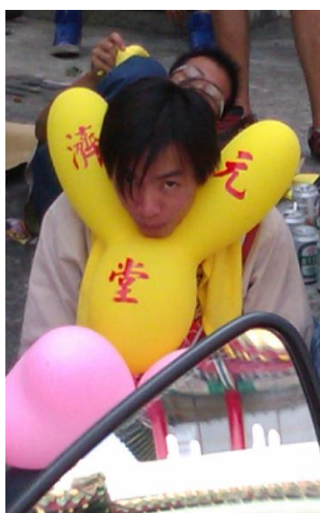
這位也是最有趣的副團長