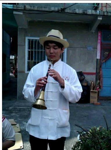
團長朋友一起協助的夥伴