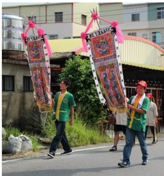
圖 1 三面旗幟

相傳哨角的由來是黃帝所設，當時十三省按君出巡，鑼聲十三響，哨角吹，代表「遊縣吃縣，遊府吃府」，最早只有兩支，後來逐年增加。