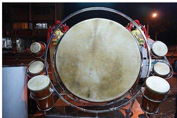
圖 4 小粒鼓、大粒鼓

近年來台灣地區發展出來獨特陣頭，一開始轎前鼓是從嘉義八掌溪跟台南麻豆還有屏東鄉村這些地方發展出來，最早只有一鼓一鑼組合而已，發展到現在兩人以上更多人以上不等的轎前鼓，轎前鼓有分很多種，常見的有一麻豆鼓，就是一般的大粒鼓跟小粒鼓。