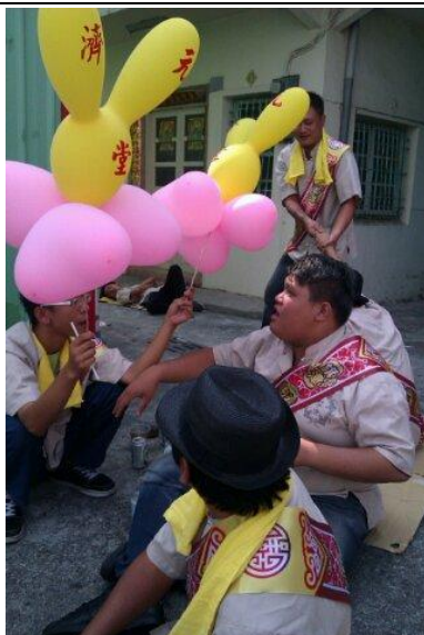
他們開得玩笑 叫他台奴