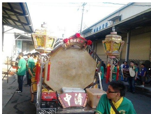
圖 3 轎前鼓