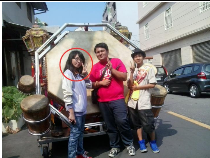
2012/10/21 旗津 與轎前鼓和團長合拍