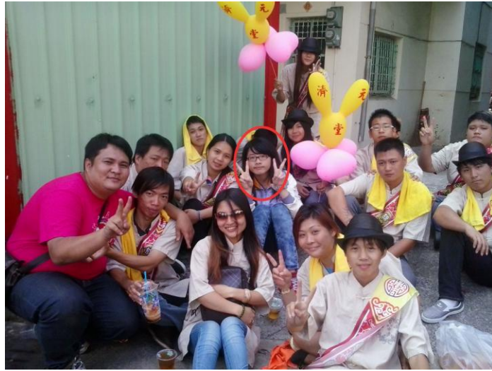
2012/10/21 旗津 濟元堂