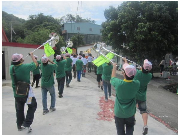
圖 7 旗津 2011/10/22

他們在此次出團時，其中團員嘴裂、破皮，沒力氣的也很多，再出團期間很少有時間能停下來休息，當走到一間又一間廟前，或是走到一定地方，必須繼續吹奏，當真正能休息的時候，大家的嘴裂的真得很嚇人，當訪問他們休息不是有喝點水了嗎？訪問中才知道水的補充趕不上吹出的力氣。